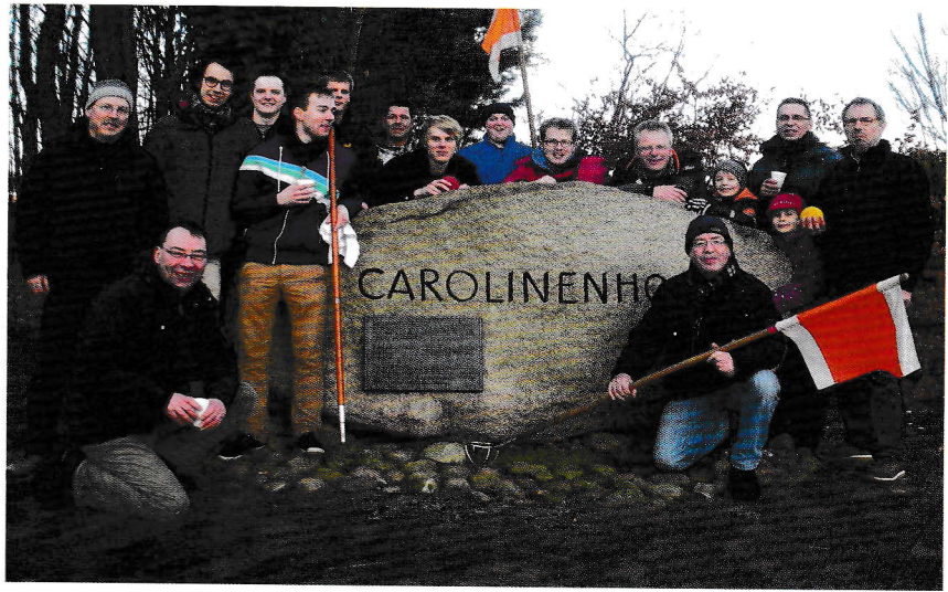
In den Grenzbereich der Landkreise Ammerland und Cloppenburg, in die Loher Ostmark zwischen Lohe und Barßel, führte die diesjährige Boßeltour der 1. und 2. Tischtennis-Männermannschaft der TSG, kurz vor dem Jahreswechsel. Nach dem Boßeln wurde auch noch die Bowlingkugel bewegt. Ein gemeinsames Essen rundete das alljährliche Treffen ab.